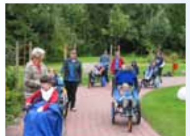
Ein Ausflug in den Tierpark. Nur mit vielen Händen möglich.